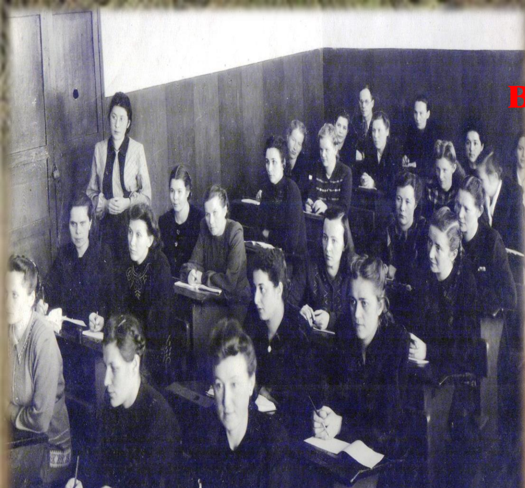
На учебе в институте