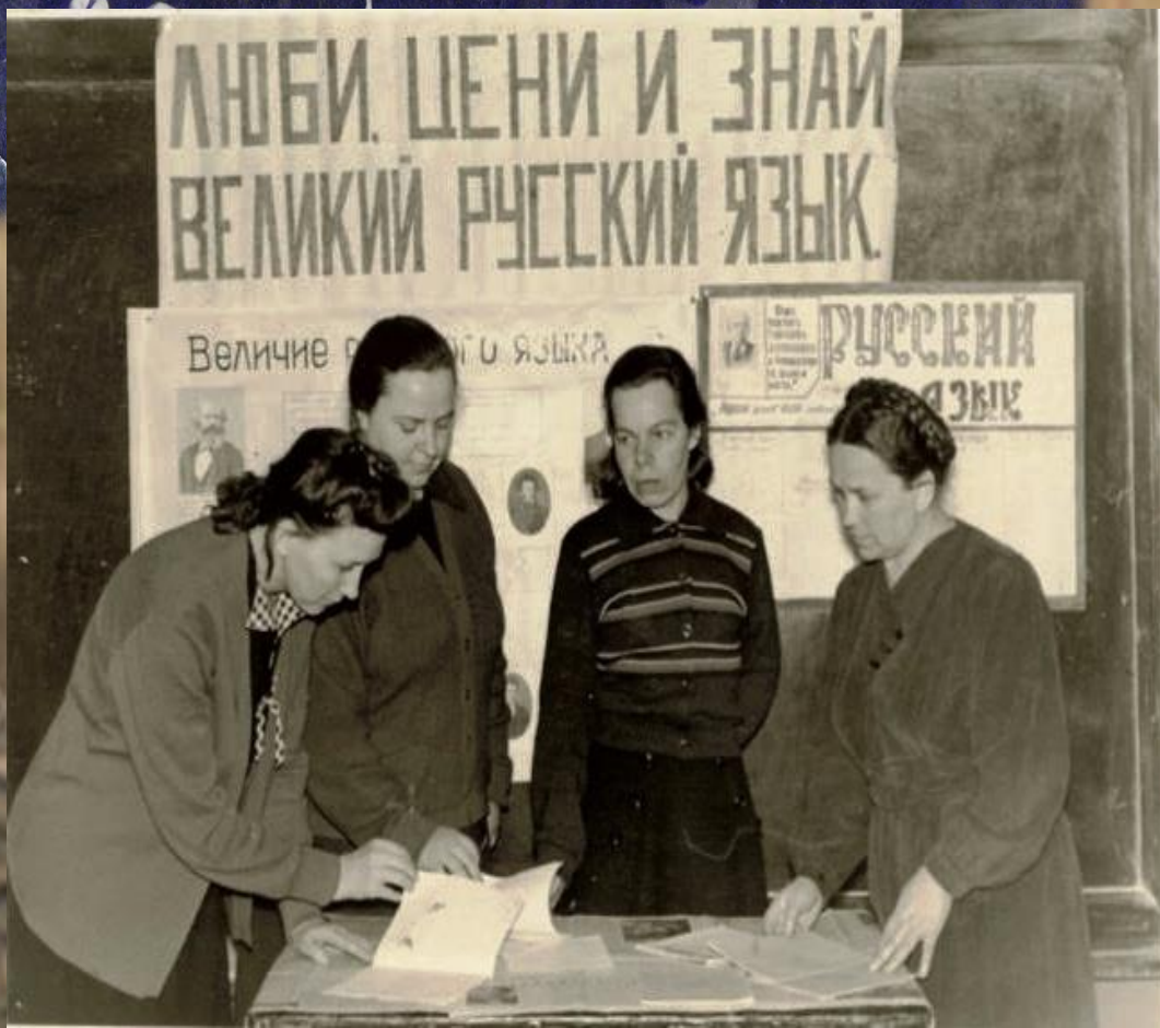
С коллегами по школе.