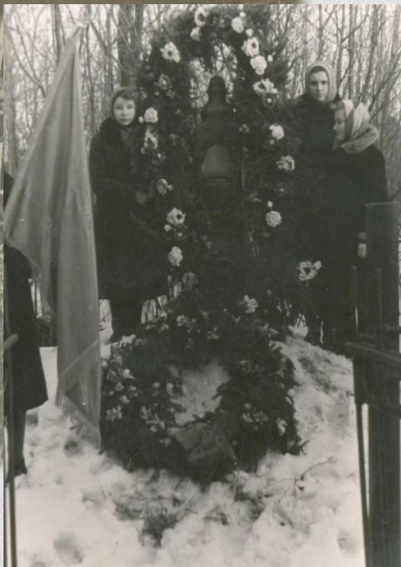
Могилы летчиков 50-60-е гг.