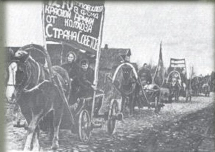
Слава хлеба для Красной армии