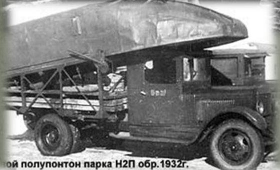
...ой полупонтон парка Н2П обр.1932г. ...ный из спецавтомобиль ЗИС-5