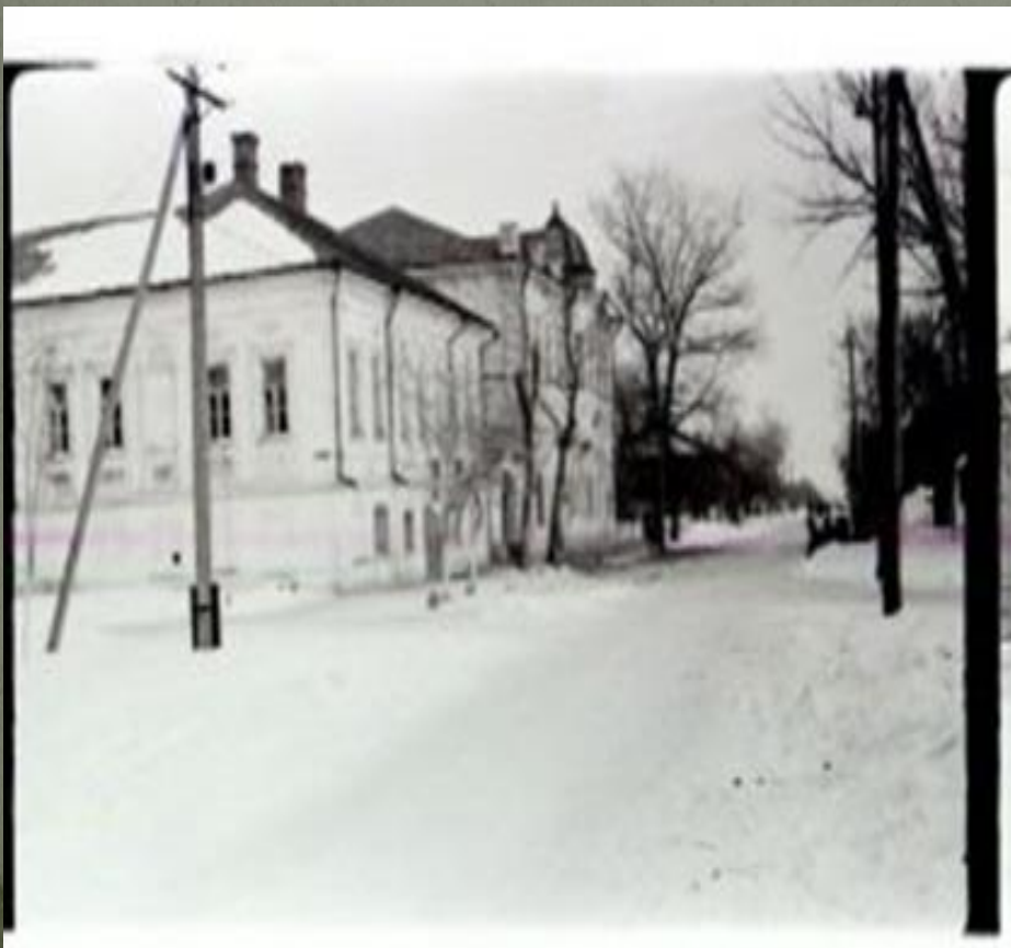
Здание штаба Данковского укрепрайона, 1941-1943гг.